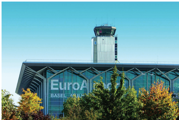
Der Kontrollturm: Ansicht von Norden bei Tag La tour de contrôle, vue depuis le nord de jour