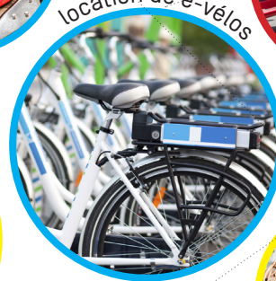
location de e-vélos