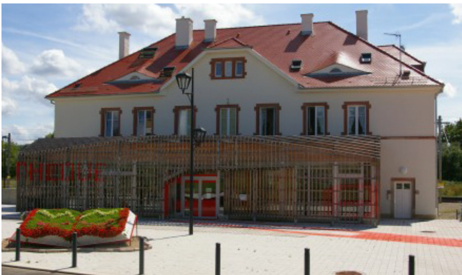
FR Mediathèque, Commune de Dannemarie > Mediathèque: www.dannemarie.fr