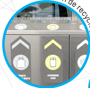
station de recyclage