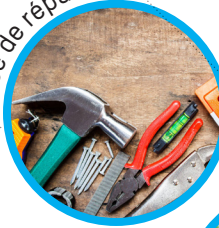
service de réparation