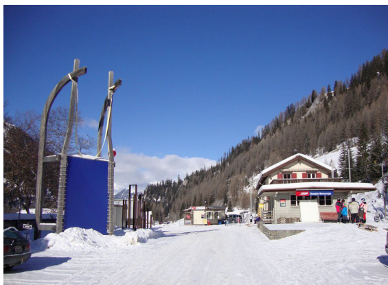
CH Bergün > Location de luges