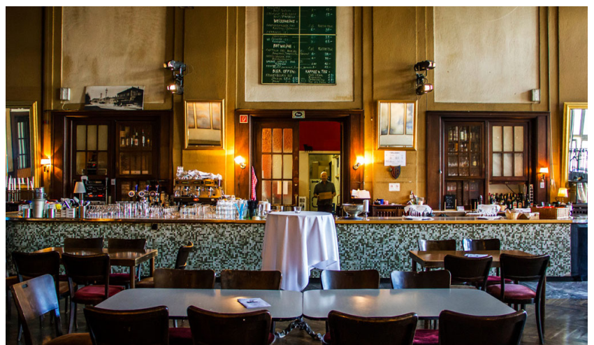
CH Basel Bad. Bahnhof > Culture / Gastronomie: www.garedunord.ch/