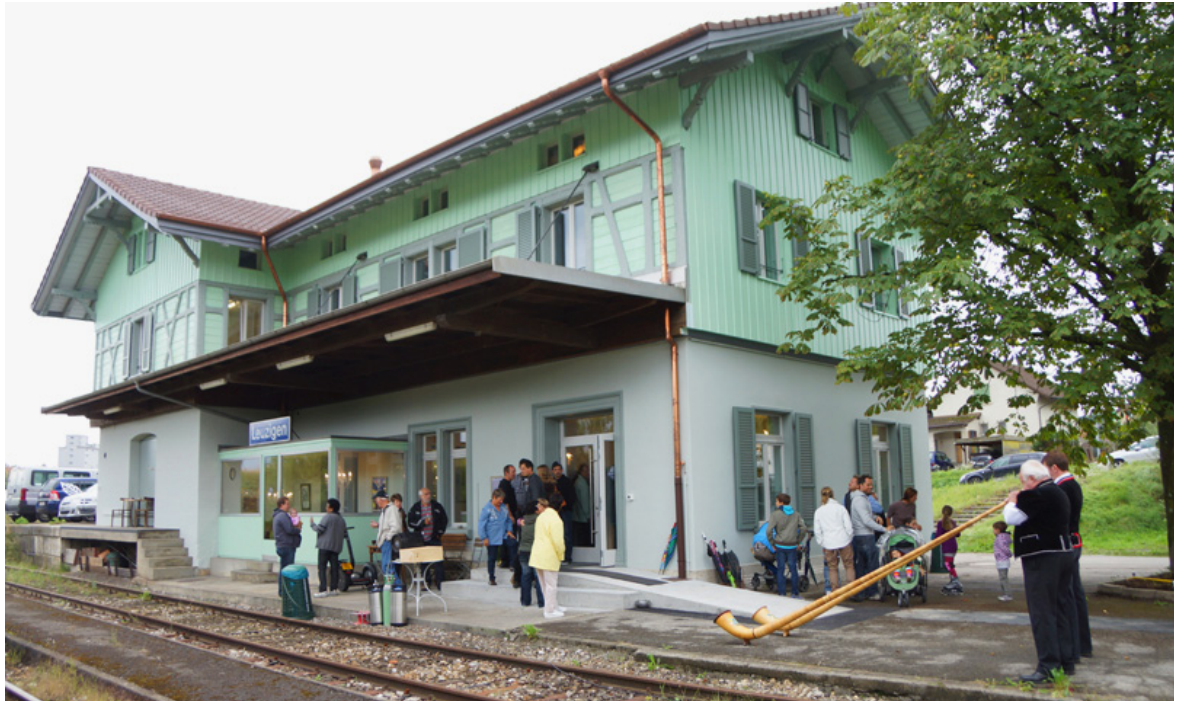
CH Leuzigen essbahnhof > Gastronomie: www.gheimtipp.ch/