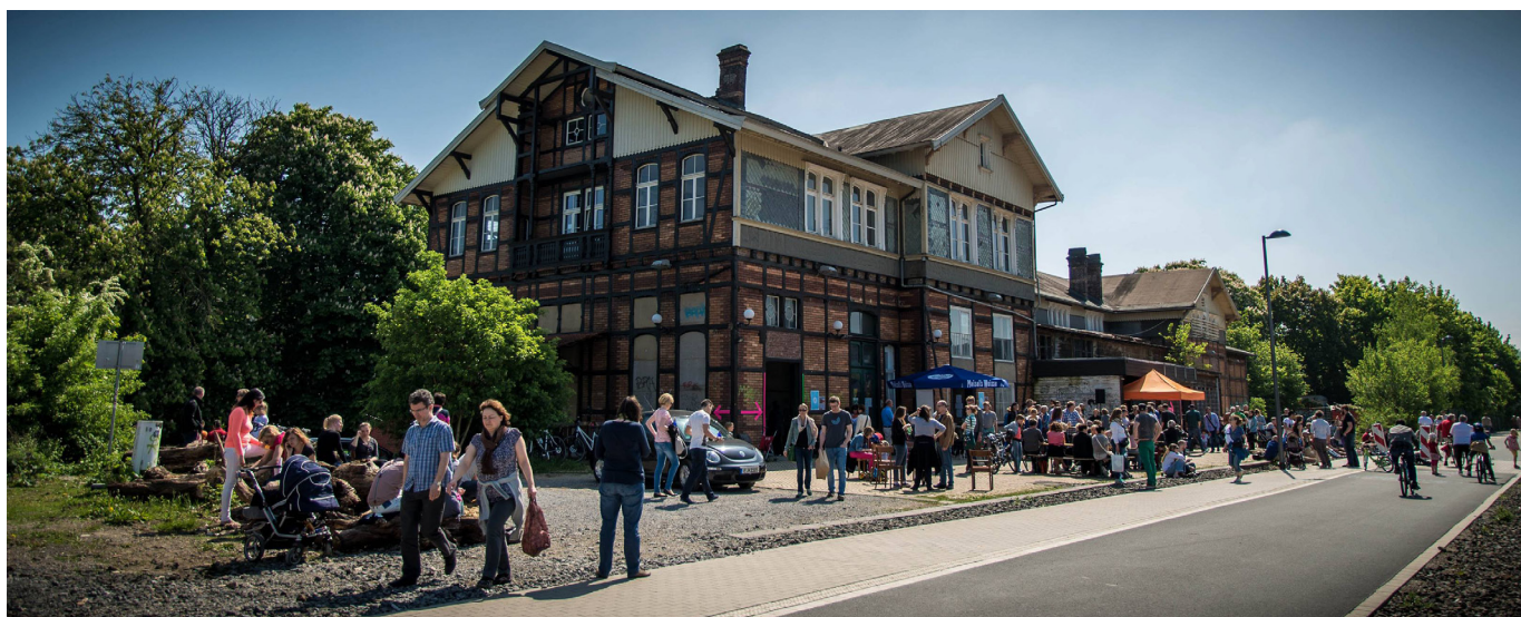
D Wuppertal Mirke > Culture / éducation: www.clownfisch.eu/utopia-stadt/bahnhof-mirke/