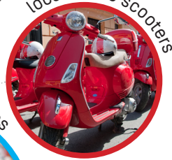
location de scooters