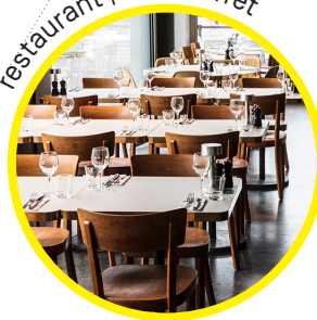
restaurant | bar | buffet