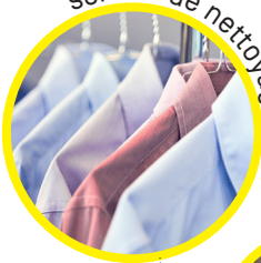
service de nettoyage