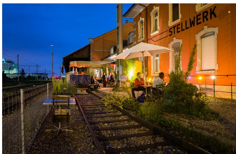
CH Basel St.Johan > Pépinière d'entreprise: www.stellwerkbasel.ch