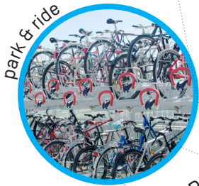
park & ride

Ces « hubs » proposeront différentes offres de loisirs permettant aux touristes ou sportifs de profiter d'espaces de détente de proximité.