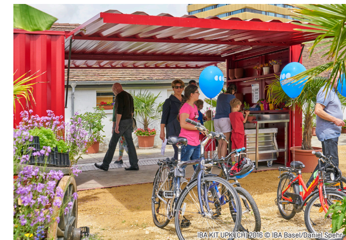
IBA KIT UPK [CH] 2016

Angaben ohne Gewähr. Änderungen vorbehalten / Informations non contractuelles, données à titre indicatif. Modifications possibles. Weitere Informationen / pour tout renseignement : margot.bernardi@iba-basel.net