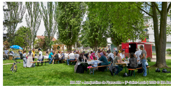
IBA Kit «Aux Jardins de Francette» (F-Saint-Louis) 2016

IBA KIT « Aux Jardins de Francette » 17, Rue Charles Péguy F-68300 Saint-Louis