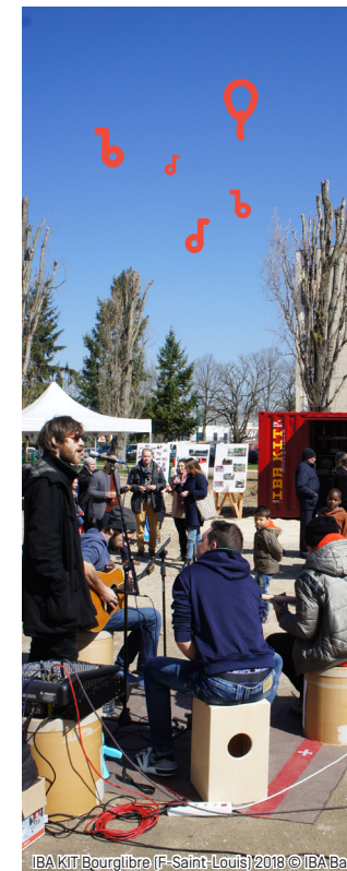
IBA KIT/Bourglibre (F-Saint-Louis) 2018

IBA KIT VITRINE Quartier DMC Rue des Brodeuses F-68200 Mulhouse