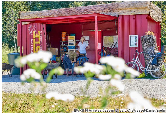
IBA KIT/Rheinfelden/Baden [D] 2016

IBA KIT NOMADE Basler Strasse 7-5 D-79540 Lörrach-Stetten